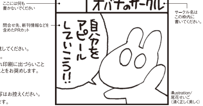
〈サークルカット作成例〉